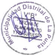
RESUMEN CENTRO DE COSTOS 02.01: ALCALDIA